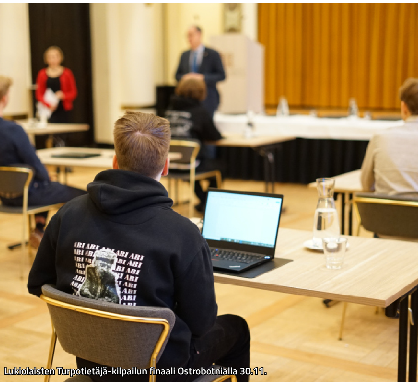
Lukiolaisten Turpotietäjä-kilpailun finaali Ostrobotnialla 30.11.

Suomen Reserviupseeriliitto Finlands Reservofficersförbund The Finnish Reserve Officers' Federation Döbelninkatu 2, 6.krs, 00260 Helsinki toimisto@rul.fi +358 40 824 4522 www.rul.fi