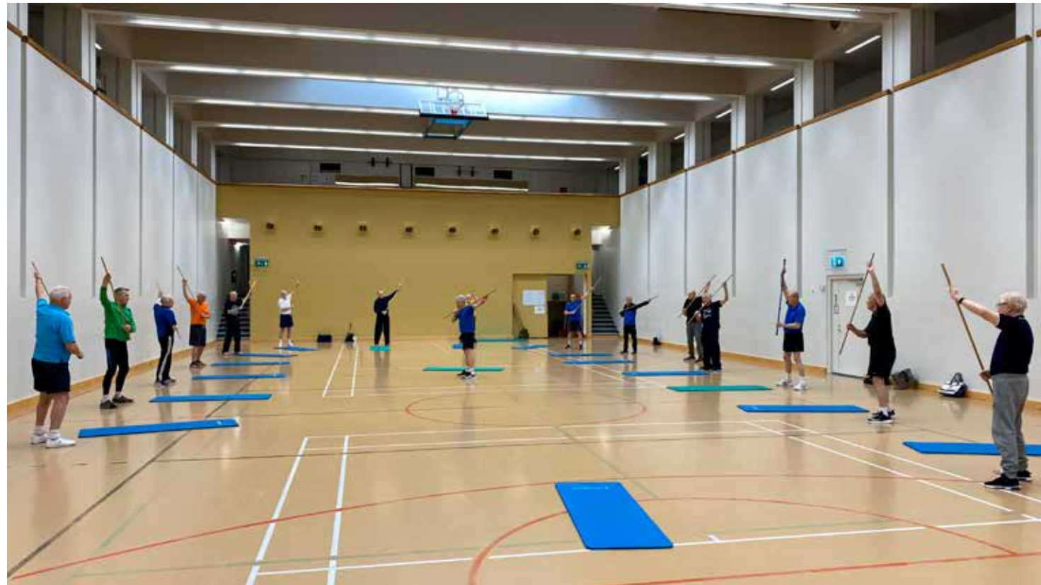
Turun Reserviupseerien kuntoiluosasto alkoi toimia jo 1960-luvun alkupuolella.