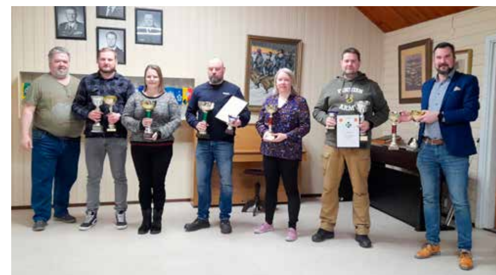
Piirien kevätkokouksissa palkittuja iloisessa rivissä.

Kokouksiin ei ollut tullut muita käsiteltäviä asioita yhdistyksiltä tai jäseniltä, joten puheenjohtajat kiittivät aktiivista kokousyleisöä ja päättivät kokoukset. Piirien toimintakertomukset ovat nähtävillä piirien kotisivuilla.