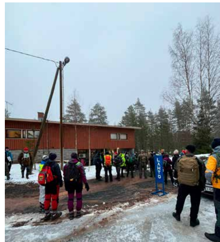
Kertunmäellä oli vilinää noin 170 kilpailijan myötä.