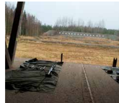
Raasin ampumaradoille ei jatkossa enää pääse pelkällä puhelinsoitolla.

Radan varannut yhdistys nimeää ammuksien johtajan, joka on velvollinen perehtymään Raasin johtosääntöön ja johtamaan ammunnat johtosääntö mukaisesti. Jos radalla on yhtä aikaa useamman yhdistyksen jäseniä, on jokaisen yhdistyksen nimettävä