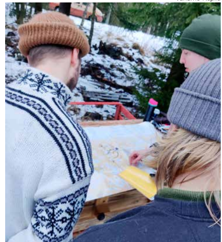
Sulutus- ja telamiinarastilla kartta havainnollisti partion tehtäväkaskyä.