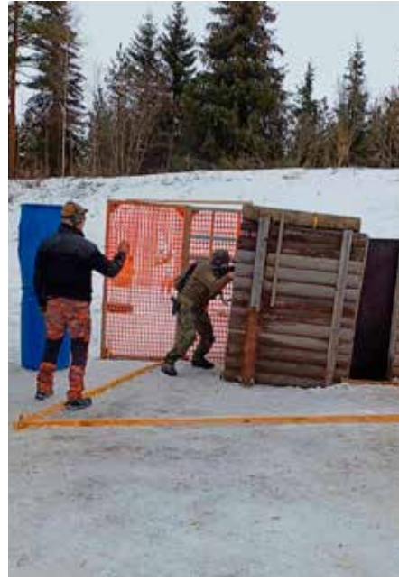
Kiväärirastiin oli mahduttettu tynnyreitä, seinä, aukkoja ja kaatuva ovi.

SRA-kisojen valmistelu alkaa noin kolme kuukautta ennen varsinaista kilpailuviikonloppua. Tällä kertaa siis marraskuussa pohdimme tarkempaa ajankohtaa kilpailulle. Talvikisa olisi mukava pitää nimensä mukaisesti talvella, mutta ajankohtaa pyritään viemään mahdollisimman pitkälle kevääseen, jotta valoisaa aikaa olisi mahdollisimman paljon. Päädyimme pitämään kisat 2-3. maaliskuuta. Tällä kerralla ajankohdan kanssa lykästi, sillä loppujen lopuksi, ei parempaa keliä voisi talvikisoille toivoa. Keli oli poutainen ja vähän plussan puolella.