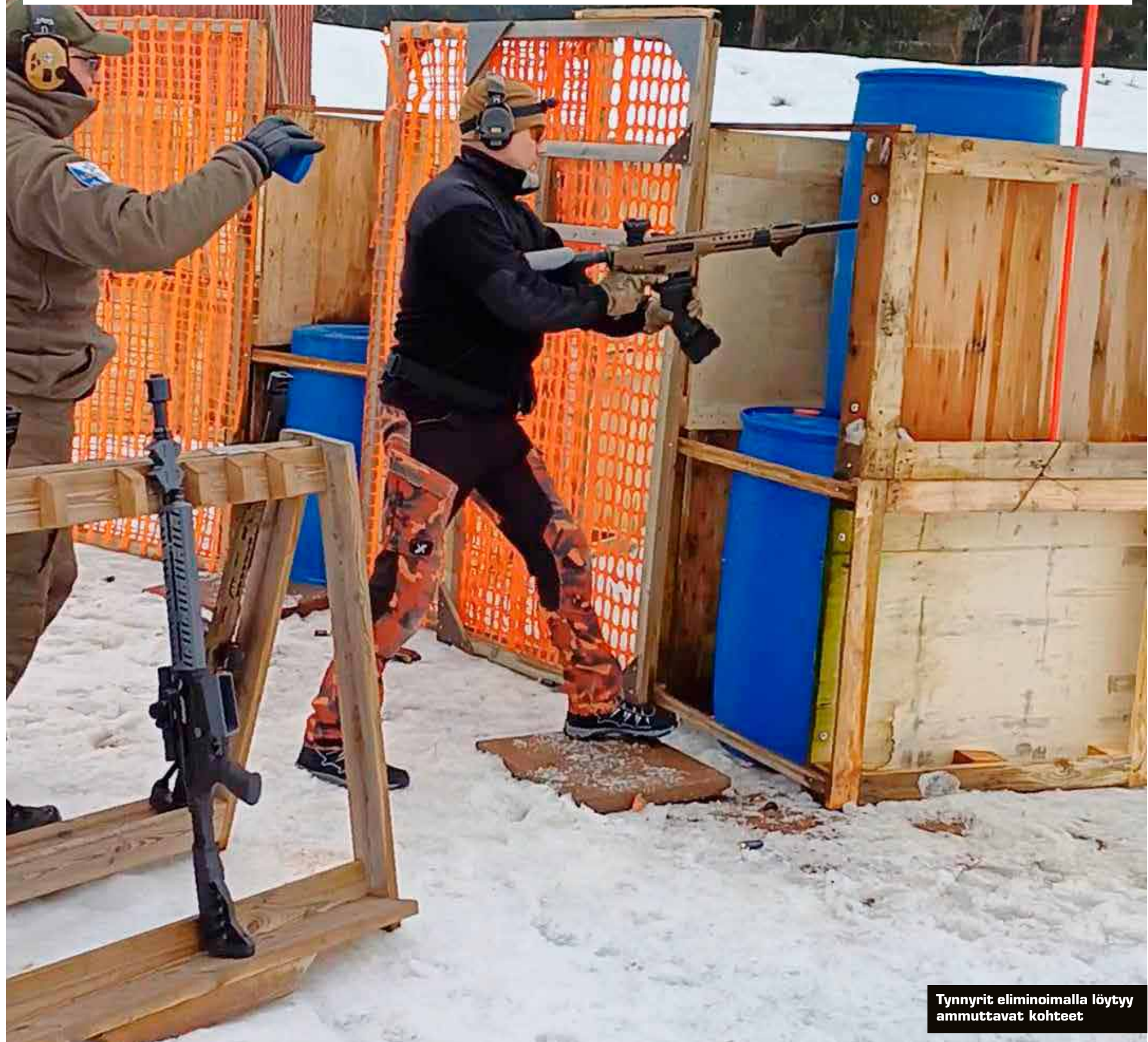
Tynnyrit eliminoimalla löytyvät ammuttavat kohteet