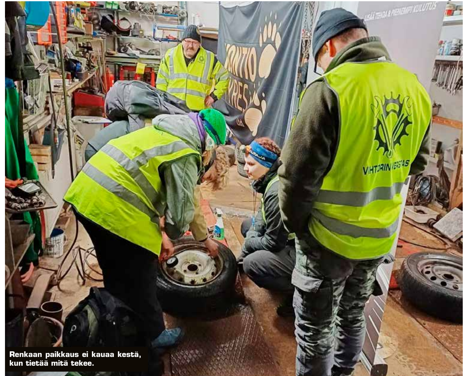
Renkaan paikkaus ei kauaa kestä, kun tietää mitä tekee.