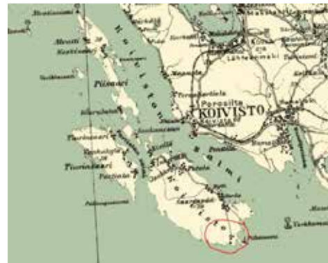
Saarenpään linna punaisella ympyröitynä.