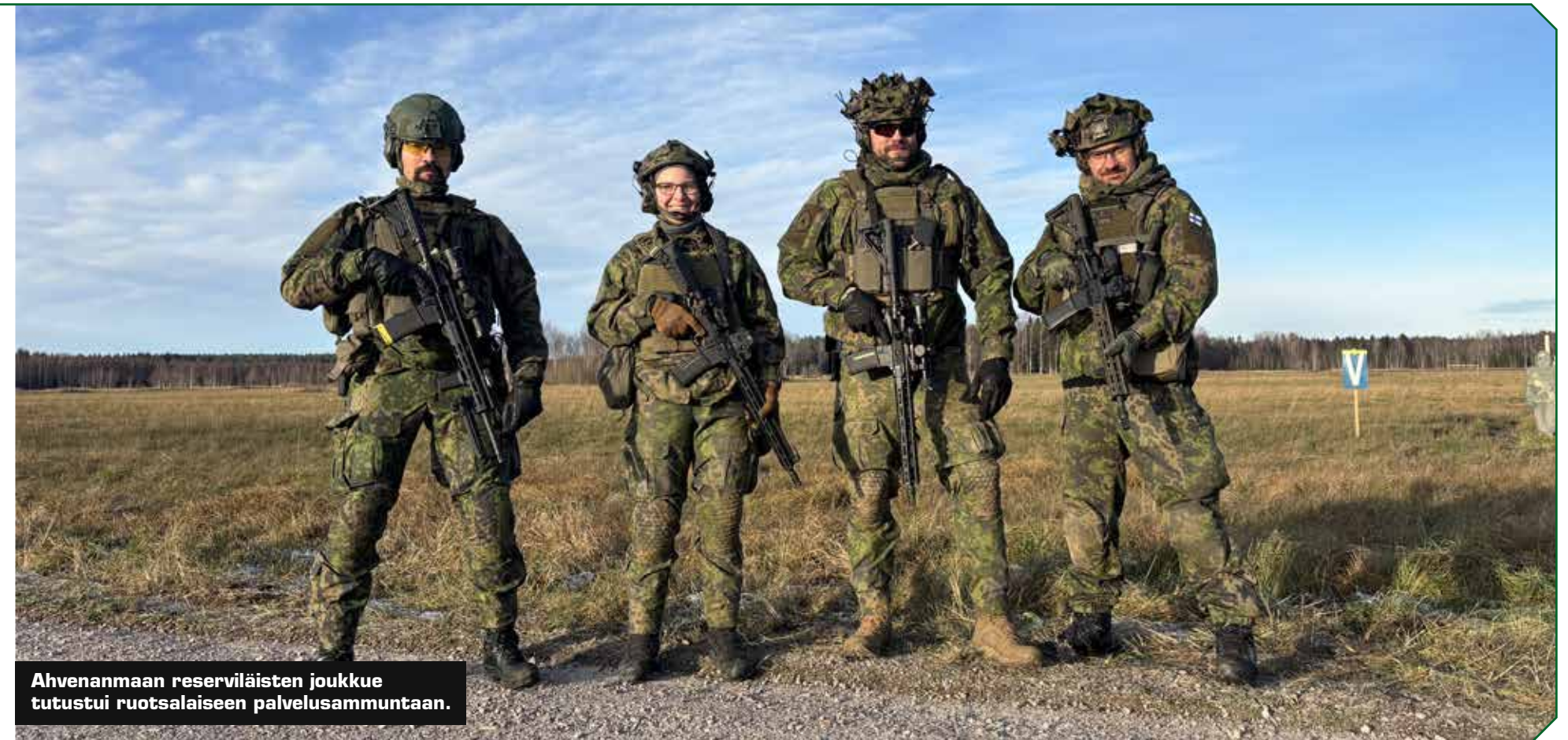
Ahvenanmaan reserviläisten joukkue tutustui ruotsalaiseen palvelusammuntaan.

isänmaalle ja sen järkähtämättömälle maanpuolustustahdolle. Kuten aiemminkin, juhla osoitti, että isänmaalliset perinteet elävät Turussa vahvoina ja kutsuvat puoleensa niin kokeneita reserviläisiä kuin nuorempaa polveakin.