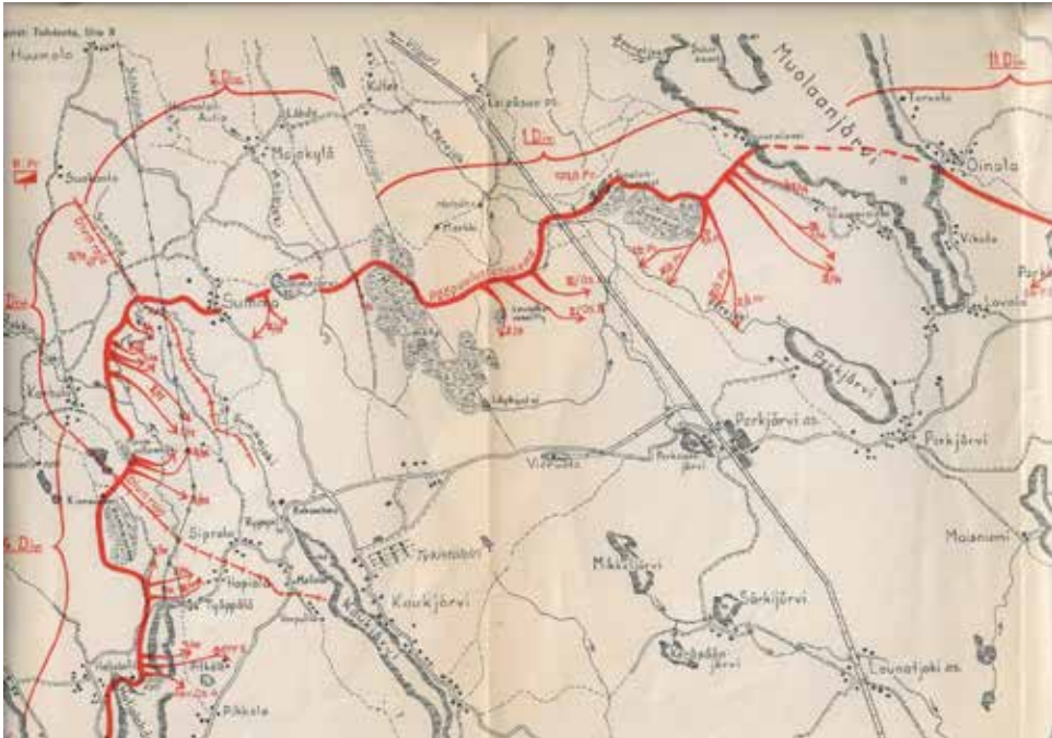
Epäonnistunut suuroperaatio 23.12.1939. Pääpuolustuslinja, ”Mannerheimlinja” Summan mutkan, 70 km, kohdalla punaisella, tavoitteet pun. nuolilla. Taaperniemi oik. Muolaanjärven rannalla. Kesk. Perkjärven Vierusta, josta rautatietykkit, ”Aavetykkit”, ampuivat 38 km päässä olevaan Viipuriin. Oik. Oinalan kylä.

Illalla AK:n komentaja neuvottelee Oinalan, Muolaanjärven itärannalla noin 10 kilometriä Muolaan kirkonkylästä länteen olevan kylän puhdistamiseksi vihollisista