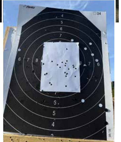
Olihan siellä osumiakin.

meiselle rastille, jolla pitikin näyttää kaksi ehjää spagettia ja ehjä, keitetty kananmuna. Ei muuta kuin kananmunan keittöön.