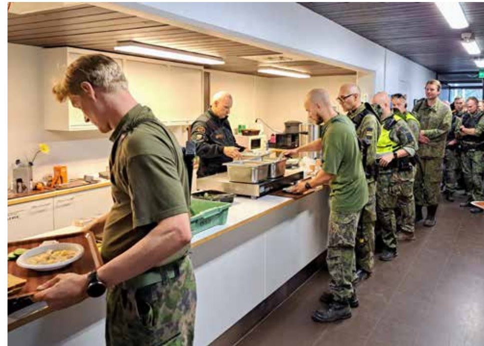
Kantahenkilökuntaa ja reserviläisiä merivartiokomppanian kertausharjoituksissa Oulun Hiukkavaarassa syksyllä 2025.

Viranomais- ja vapaaehtoisuusyhteistyö on tärkeässä roolissa merialueilla ja harvaan asutuilla seuduilla, joissa välimatkat ovat pitkiä ja partioita harvassa. Jokapäiväiset yhteistyökumppanimme löytyvät Oulun