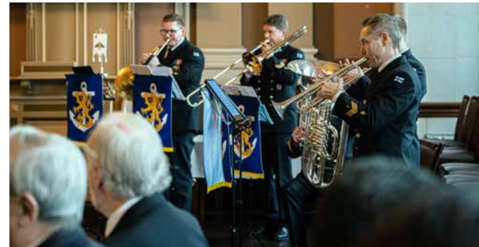
Laivaston soittokunta tahditti päiväjuhlau.