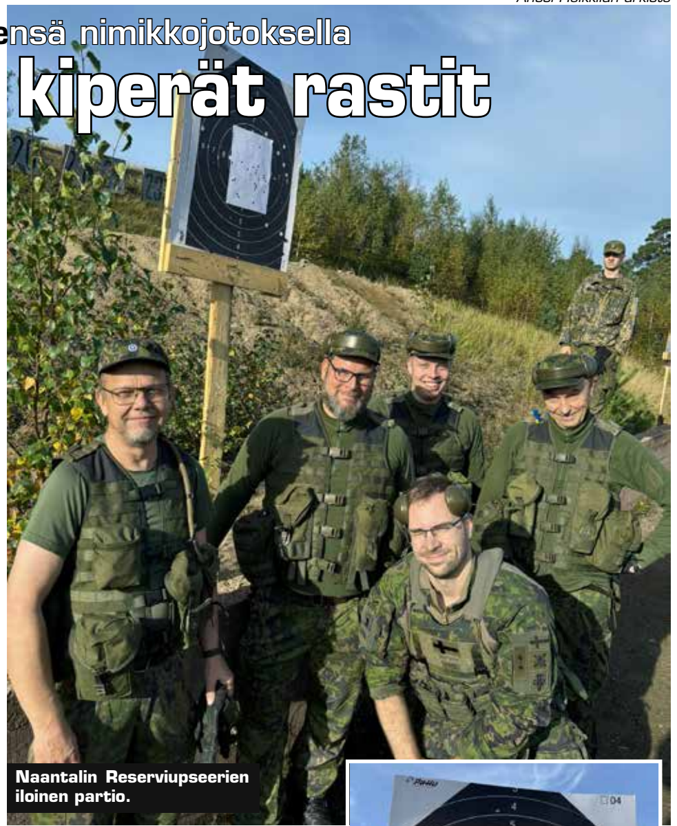
Naantalin Reserviupseerien iloinen partio.

Parin viimeisen tielenkin aikana rasteina olivat puolijoukkueeltaan pystytys ja kasaus sekä puun korkeuden arviointi ja länsilounas-suunnan osoittaminen maassa olevalla viisarikellolla. Nerokas oivallus rastijärjestäjältä, miten suoritus voidaan tehdä täysin vertailukelpoisesti kaikkien partioiden välillä. Illan jo pimennettyä saavuiimme vii-