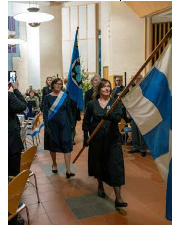
Juhla oli arvokas mutta lämminhenkinen.

Yhdistys katsoo tulevaan rauhallisin mielin, mutta varautuen ja kehittämisen kokonaisturvallisuuteen liittyvää toimintaa edelleen.