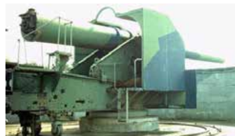
254 mm rannikkotykki.