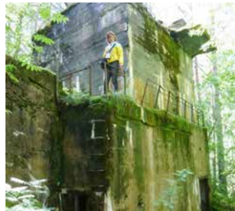
Saarenpään tulenjohtotorni: Kuva Suomen Sotahistoriallinen seura.