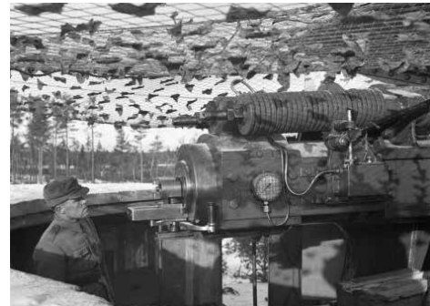
254 mm rannikkotykki.