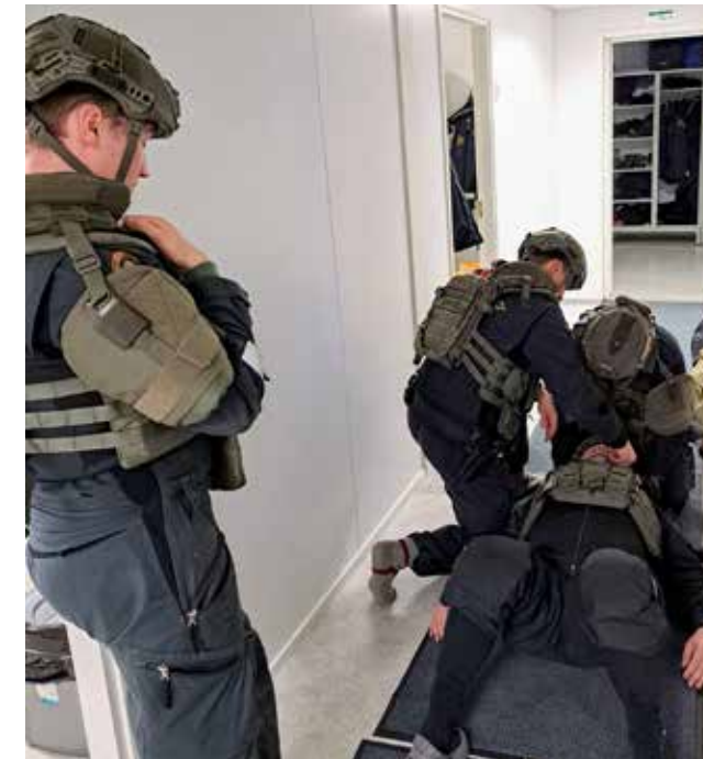
Taisteluensivun koulutus käynnissä.