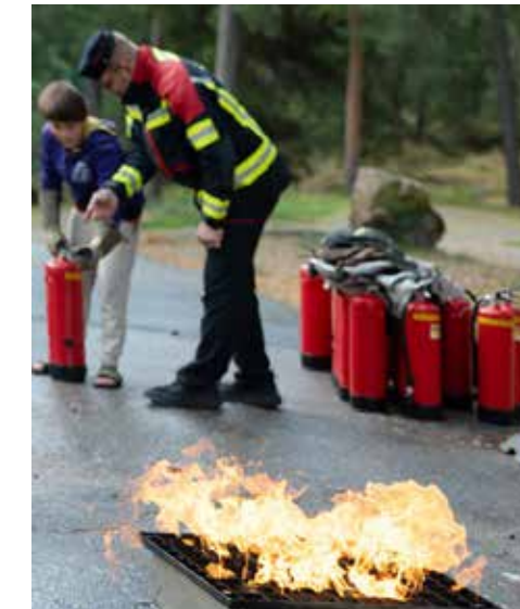
Alkusammutustaito on osa jokaisen varautumista.

Tapahtuman järjestivät Naantalien Reserviupseerit, Naantalien Reservialipuseerit, Naantalien Maanpuolustusnaiset, Naantalien Martat, Merimaskun VPK, Naantalien VPK, Rymättylän VPK, Naantalien Seudun