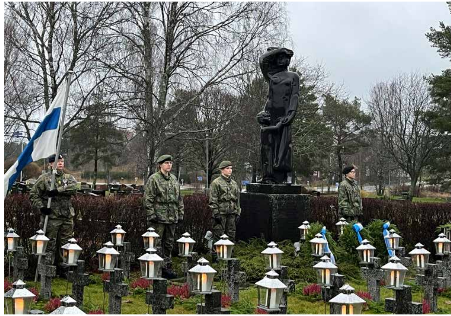
Kustavin sankarihauhdalla nähtiin harvinainen näky; ainoastaan naispuolisista reserviläisistä koostuva kunniavartio.

Toki poikkeusolojen aikana muissakin kuin asellisissa tehtävissä tarvitaan kyy-