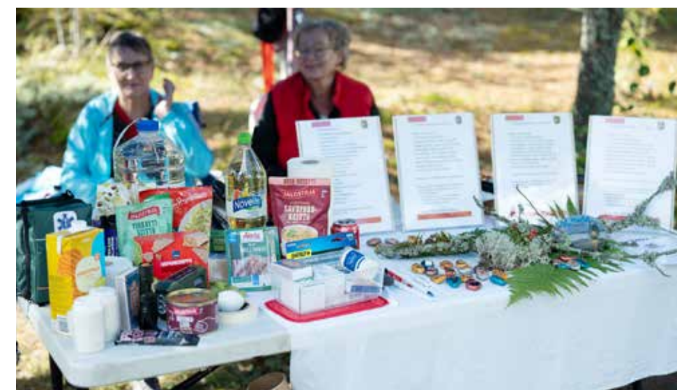
Kotivara on syytä olla kunnossa kaikkina aikoina.

Tapahtumapäivän aamun sade verotti osallistujien määrää, mutta paikalle uskaltuneilta osallistujilta saatu palaute oli pelkästään positiivista, ja samantyyppinen tapahtuma on suunnitteilla tällekin vuodelle.