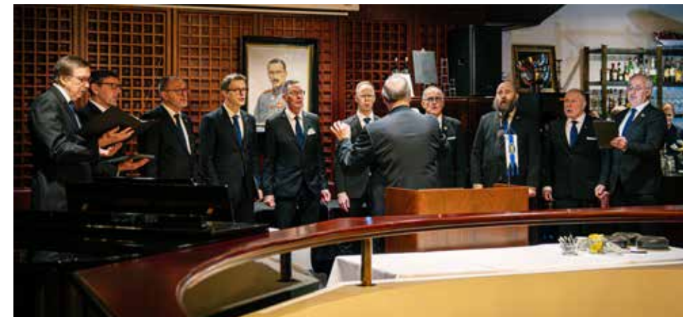
Mieskuoro Laulun ystävät esitti vironkielisen kappaleen Me peame looma sillad.

vokkaan ja tyylikkään tervehdysten. Kuoron ohjelmistosta jäi erityisesti mieleen koskettava vironkielinen teos Me peame looma sillad, joka toi esitykseen kansainvälistä veljeyden sanomaa.