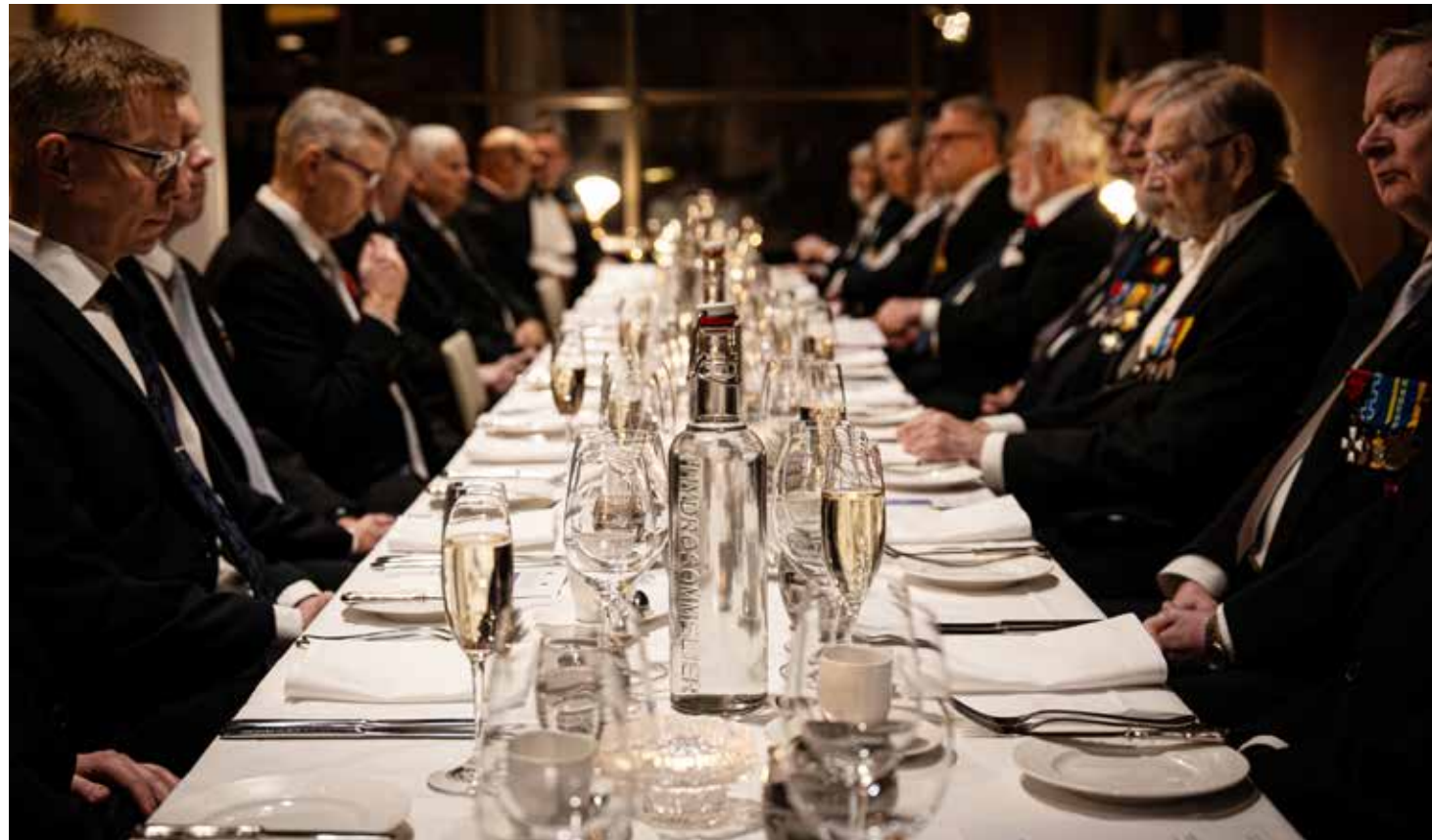
Tammisunnuntaita on juhlistu Turussa jo vuodesta 1985.