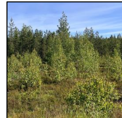
KUVA 1: avoin alue 1