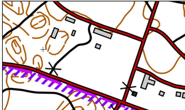
KUVA 6: Kilpailukeskuksen sijainti

Kilpailujoukkueet saapuvat Taipalsaaren harjoitusalueelle omilla ajoneuvoilla. Kilpailukeskuksen sijainti RANTATIE 126, TAIPALSAARI.