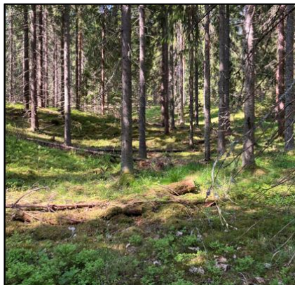
KUVA 4: Kuva kilpailualueelta

Maastopohja on pääosin kovaa ja hyväkulkuista. Korkeuseroja on maltillisesti vaikkakin supprien pohjilta tuleekin nousta useasti ylös. Teitä ja polkuja löytyy alueelta suunnistuksen tueksi. Rastien koodien kanssa tulee olla tarkkana ja ymmärtää partion saamat tehtävät. Näkyvyys on pääsääntöisesti hyvä ja vaikka tiheikköjä onkin kilpailualueella, on ne pyritty huomioimaan rastien sijoittelussa.