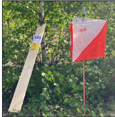
KUVA 5: Kuva rastista

Rastit on merkitty maastoon oranssivalkeoisilla rastilipuilla sekä yökilpailussa ympäriinsä heijastavilla heijastinnauhoilla. Rastilla on numerotunnus ja leimasin ns. "lautapukissa"