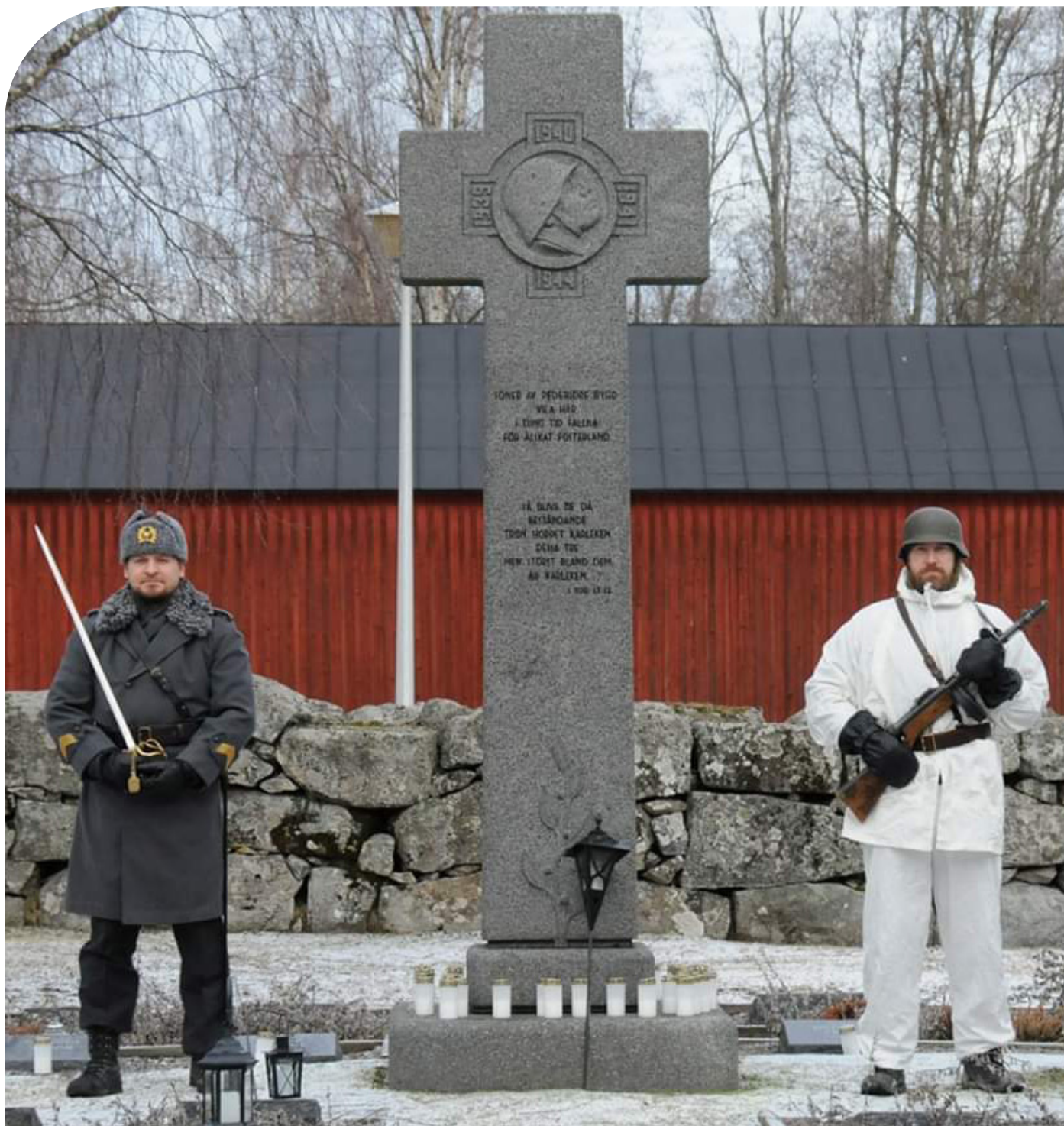
Pietarsaaren Reserviupseerit