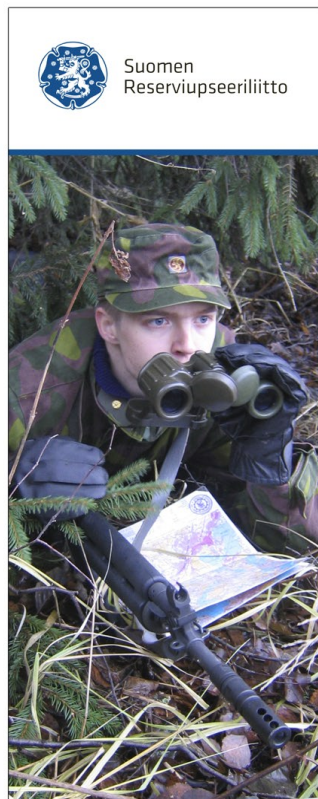
Uudet esittelyseinät (Roll-up:it)