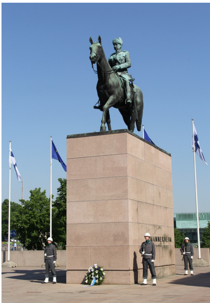
Puolustusvoimain lippujuhlan päivä 4.6.2013